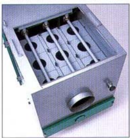
●自動脱塵装置エア配管部

1 コンプレッサー内蔵の自動脱塵装置を搭載、プレフィルターに付着した粉塵はエアの逆洗方式により、自動的に脱塵、フィルターの清掃を容易にしました。