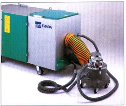
●本体にクリーナー(ダストバック付掃除機)を装着

4 ダストボックスにたまった有害粉塵は、吸引口よりクリーナー(ダストバック付掃除機)で回収、手を汚さずに廃棄することができます。また、クリーナーの排気は、さらにダクトを取付け、集塵機本体に戻し、二次飛散を防止、作業の安全とメンテナンス性に配慮しました。