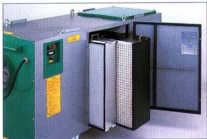
●HEPAフィルター(手前)とチャコールフィルター

2 厚生労働省基発第401号に準拠、高性能なチャコールフィルター& HEPA フィルターの採用で捕集効率を大きくアップ。(0.3 μm 粒子で 99.97%まで除去) 安心と安全なクリーン環境の実現を最優先しました。